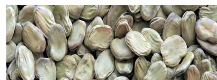
Fava larga di Leonforte