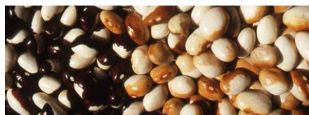
Fagiolo Badda di Polizzi